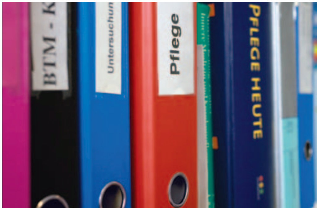
Pflegeberufe: Reintegrationschance für Arbeitslose.

Jene Stellensuchenden, die einen Ausstieg aus dem zuletzt ausgeübten Beruf im Gesundheitswesen anstreben, weisen