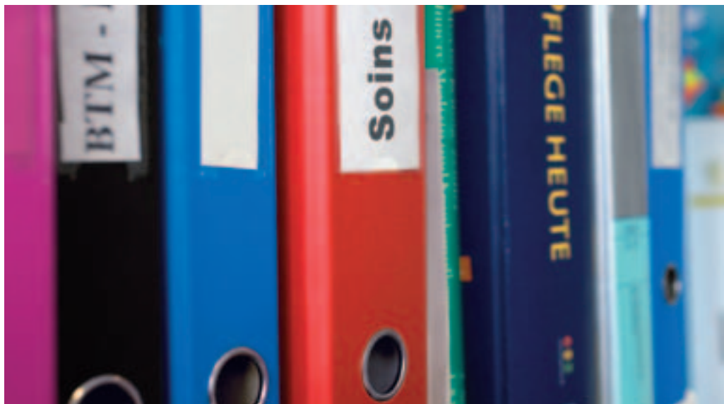
Professions des soins: souvent un nouveau départ.

En comparaison, les demandeurs d'emploi qui souhaitent s'insérer dans les professions de la santé montrent une bonne aptitude pour les professions des soins. Les déficits significatifs se situent uniquement au niveau de l'adaptabilité professionnelle et des connaissances méthodologiques. L'identification avec la profession exercée antérieurement est nettement réduite. En outre, les demandeurs d'emploi désirant s'insérer pour la première fois dans ces professions ont de nets potentiels concernant la conscience professionnelle et l'orientation vers autrui. Comparés aux personnes actives, ils travaillent avec davantage d'exactitude, plus soigneusement, de manière plus fiable et sont plus ouverts aux autres. Des analyses plus poussées montrent que chez les demandeurs d'emploi cherchant