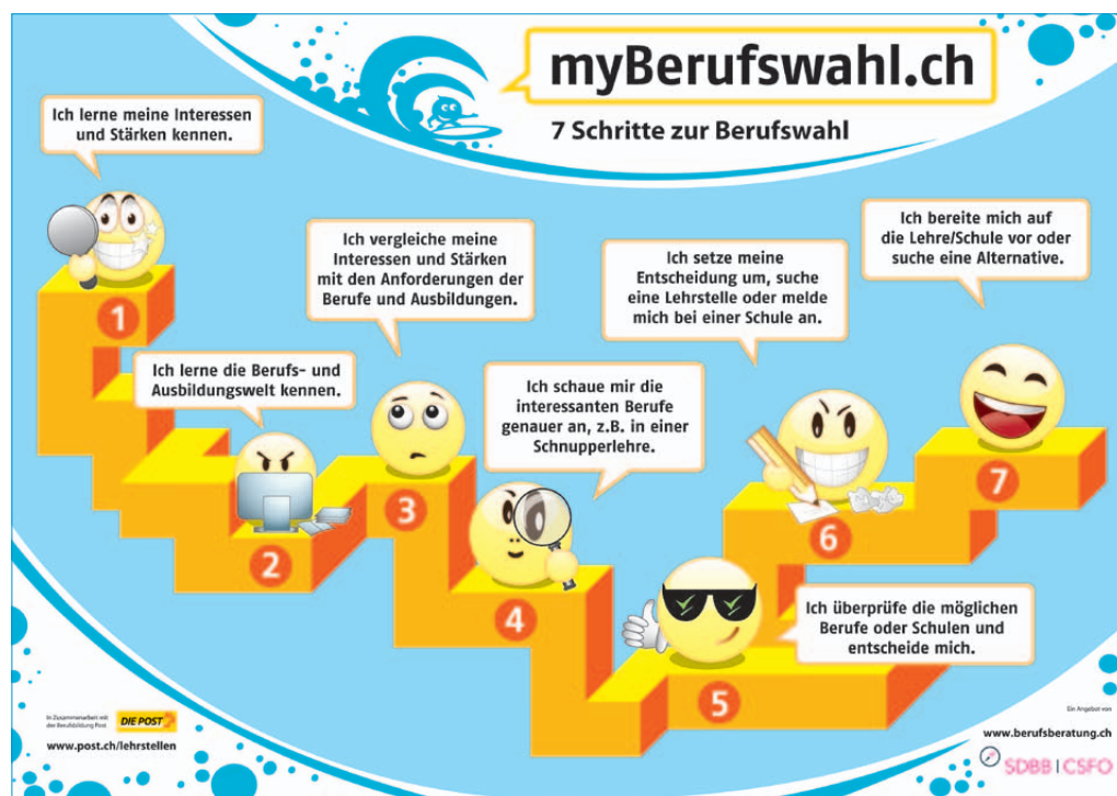
Die sieben Schritte von myBerufswahl.ch : Poster für den Aushang im Schulzimmer.

Dadurch, dass myBerufswahl.ch vollkommen virtuell ist, unterscheidet es sich von anderen Berufswahlmedien wie dem Berufswahltagbuch von Egloff oder dem Berufswahl-Portfolio von Schmid und Barmettler. Immerhin: Von der «Landkarte» gibt es Postkarten und ein Poster fürs Klassenzimmer. Und das Logbuch kann ausgedruckt werden und wird damit Teil eines Berufswahldossiers.